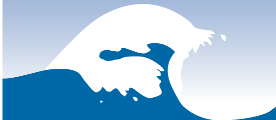
TABLA DE MAREAS