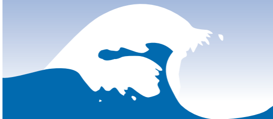
TABLA DE MAREAS